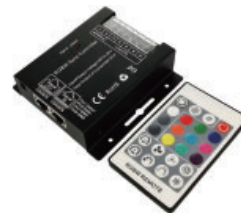
32A(8A/ch)、DC12-24V、リモコン付、明るさ調節可

商品コード SPLT-ELL-CTRL-DC-RGBW4-20A-RC-ANYCOL-R2