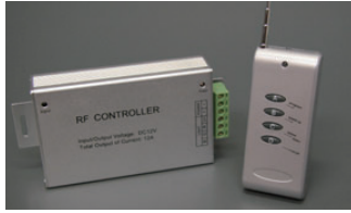
12A(4A/ch)、DC12-24V、リモコン付、明るさ調節不可