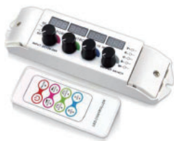
任意色固定可能 R2、20A(5A/ch)、12-24V、リモコン付、明るさ調節可