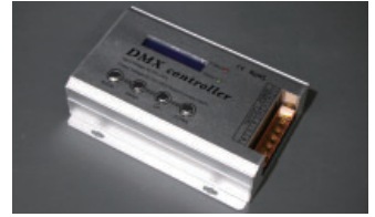
DMX-RGB3ch コントローラ、出力 DC100V