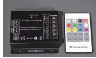
30A(10A/ch)、DC12-24V、リモコン付、明るさ調節可

商品コード SPLT-ELL-CTRL-DC-RGB3-18A-RC-ANYCOL-R2