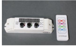
任意色固定可能 R2、18A(6A/ch)、リモコン付、明るさ調節可